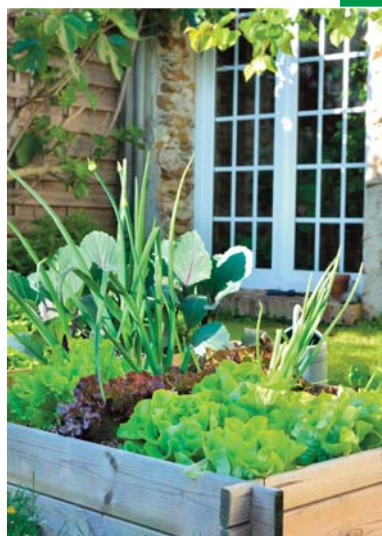
Skrzynie uprawowe to wygodny sposób na założenie tzw. ogródka kuchennego