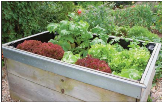
Uprawa wczesnych warzyw liściowych – skrzynia z sałatą kolorową

W skrzyniach dobrze rosną pomidory samokończące o niezbyt dużej sile wzrostu (np. Maliniak, Ola Polka, Etna F 1 ) i papryka słodka o pokroju krzaczastym (np. Roberta F 1 , Oda, Marta Polka). Siewając fasolę szparagową karłowatą, wybieramy odmiany pełne, ale niezbyt silnie rosnące (np. Polka, Galopka, Żłota Saxa, Korona).