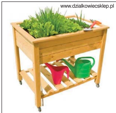
Wygodny stół uprawny spełnia rolę małej ruchomej grządki. Produkt dostępny na www.dzialkowiecsklep.pl