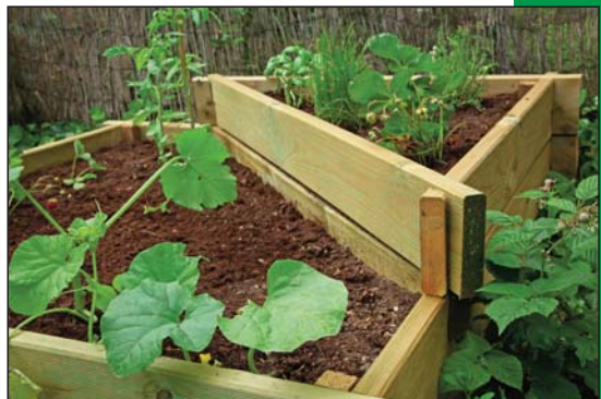
Różne rodzaje skrzyń