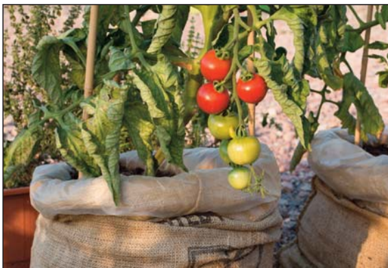
Uprawa pomidorów w wysokim worku

Sposób wycinania w worku otworów do sadzenia rozsady