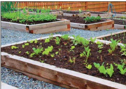
Skrzynie ustawione kaskadowo na pochyłym terenie